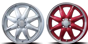
Machining Pearl White Machining Candy Red

※製品重量はバルブ、ホイールキャップを外した単体重量です。製品による誤差が生じる事を ご了承ください。また、all-oneは15×5.0サイズの重量となります。