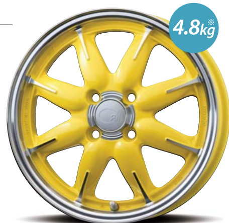
Machining Lemon Yellow

※製品重量はバルブ、ホイールキャップを外した単体重量です。製品による誤差が生じる事を ご了承ください。また、all-oneは15×5.0サイズの重量となります。