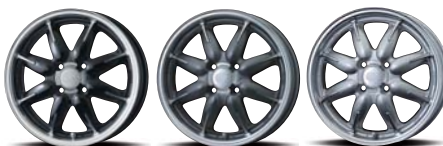
Machining Black Machining Gunmetallic Machining Silver