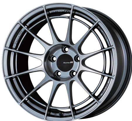
Hyper Silver : 18inch (Rear Face)