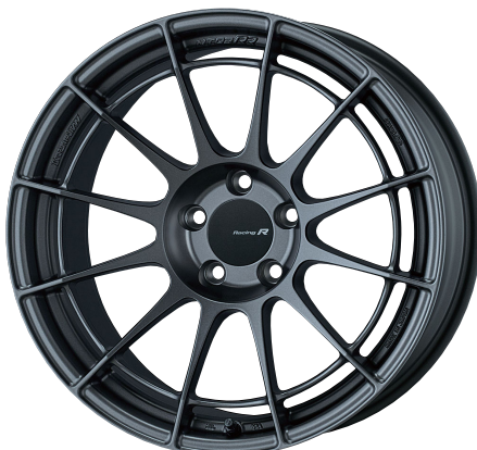
Matte Dark Gunmetallic : 18inch (Rear Face)