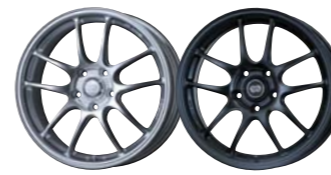
Sparkle Silver Matte Black

COLOR : Sparkle Silver, Matte Black SIZE : 15×5J~18×10½J | PRICE : ¥27,000~¥45,000 (税別)