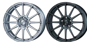
Sparkle Silver Matte Dark Gunmetallic

COLOR : Sparkle Silver, Matte Dark Gunmetallic SIZE : 15×5J~18×7½J | PRICE : ¥27,000~¥38,000 (税別)