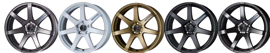
Dark Silver Pearl White Gold Matte Dark Gunmetallic SBK

PF07-COLORS: LIMITED EDITION | COLOR: Pearl White, Gold, Matte Dark Gunmetallic, SBK | SIZE: 15×5J, 16×5J, 18×7½J~8J, 18×8J | PRICE: ¥27,000~¥51,000 (税別)