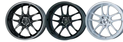
SBK Matte Black Pearl White

COLOR : SBK, Matte Black, Pearl White SIZE : 17×9J~18×10½J | PRICE : ¥43,000~¥55,000 (税別)