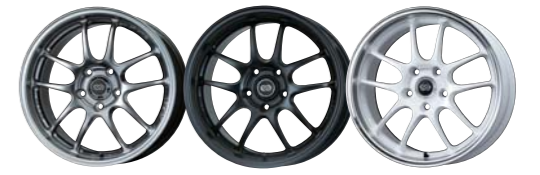
PMS Matte Black PMW

COLOR : PMS(Platinum Machined Silver), Matte Black, PMW(Pearl Machined White) SIZE : 17×9J | PRICE : ¥43,000 (税別)