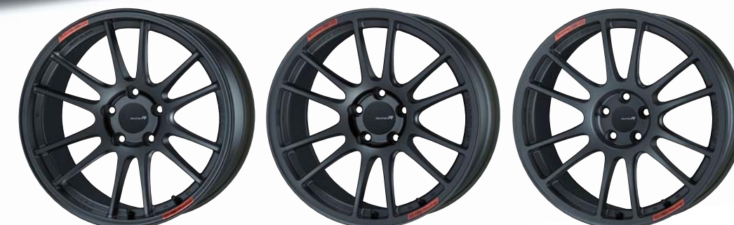
18inch : Rear Face