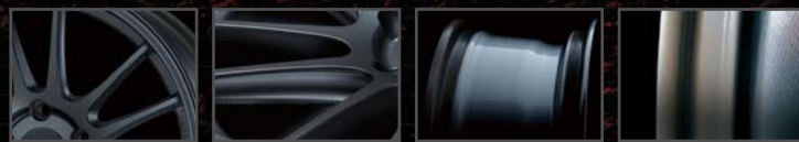
TWIN SPOKE DESIGN H CROSS SPOKE MAT-DURA FLOW FORMING ANTI-SLIP PAINT

超高剛性をコンセプトに開発され、多くの有力チューナーより絶大な支持を集めた「GTC01」発売から10年、「究極の市販ホイール」を目指し、一切の妥協を排除し創り上げた「GTC01RR」が新登場。長年に渡るレースフィールドへの挑戦から蓄積された経験を基に、最新のCAE (Computer Aided Engineering) 技術と製造テクノロジーを駆使し、高剛性と軽重量をENKEIの次世代基準で両立。ディスクデザインは「GTC01」を踏襲しつつも、さらに鍛え抜かれたスバルタンな機能美が宿る。さらに、MAT-Dura Flow Forming により生み出されるリムプロファイルと、応力分散に優れたスプリット6スポークが、ホイール真円を保つための必須要素「剛性力」を高めスポーツ走行時の極限下においても、ホイールの性能、更にはタイヤ、車の運動性能を遺憾なく発揮させる。また、応力集中の少ないスポークサイド部を大胆に削り落とす「H CROSS SPOKE」により、サーキットでの戦いに不可欠なホイール剛性を損なう事無くグラム単位のシビアな軽量化を達成。フロント/ミドル/リアの3種類の「コンケイブ(中下がり)」フェイスを用意し、車種に応じた最適な深さが装着可能となった。