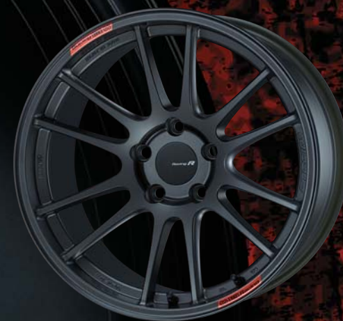
18inch : Rear Face