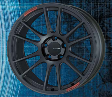
18inch : Middle Face