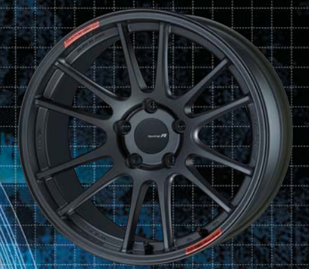
18inch : Rear Face