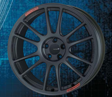
18inch : Front Face