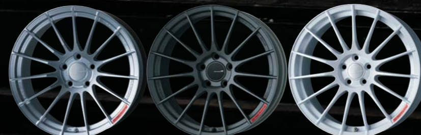
Sparkle Silver : Rear Face