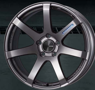
Dark Silver : 18inch (Rear Face)